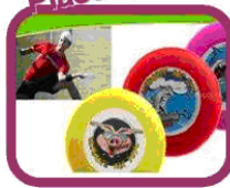
freesbee, bloc notes