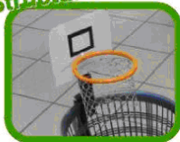
mini panier de basket