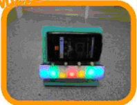
support lumineux pour téléphone